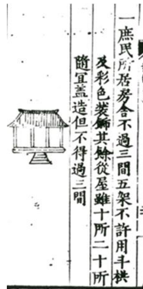
图二《礼制集要》所载庶民房舍规范

以二十四孝为代表的贤人故事，是宋代以来墓室壁画最常见的主题之一 7 。日月龙凤图像，亦见于元代壁画墓，在千佛山齐鲁宾馆、平阴李山头 and 内蒙古沙子山元墓中均有发现；长子碾张村元代壁画墓，则在墓顶藻井四周绘画二十八宿星象，东西两壁分别彩绘日月和祥云玉兔 8 。而到明初，绘饰这类圣贤与祥瑞图像，均属违背禁令之举。洪武十七年，明廷又下令官民房屋不得装饰藻井 9 。藻井也是元代壁画墓的常见装饰。山西长治司马乡元墓 10 、文水北峪口元墓 11 、交城裴家山元墓 12 、河南焦作老万庄二号墓等，均在墓顶绘饰藻井。山东地区元代壁